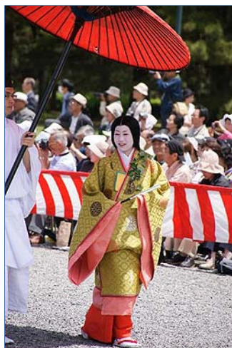
すばるちゃんさんさん

風鈴のような風情がある構成で涼やかです。同じ距離のピントの合う位置にある二つの花を選んだのが良かった。もう一輪を脇役にぼかして入れたのも流石です。